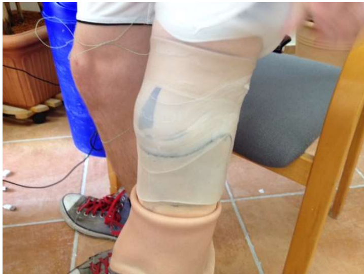
Temperaturaufzeichnung Prothese mit und ohne PCM-Einlage