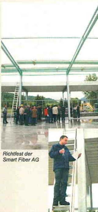
Richtfest der Smart Fiber AG

Das Jahr 2006 war das Jahr der Markterschließung und Diversifizierung. Mit der Gründung der Smart Fiber AG 2005 wurde der Anstoß zur kommerziellen Vermarktung der funktionellen Cellulose-Fasern gegeben. Erstmals ist es dadurch dem Institut gelungen, eigene Werkstoffentwicklungen mit einem Investor auf den Markt zu bringen. Am 30.03.2006 wurde im Gewerbegebiet Rudolstadt-Schwarza das Richtfest für die erste Produktionshalle der Smart Fiber AG gefeiert. Seit Oktober 2006 erfolgt die Serienproduktion der Fasern.