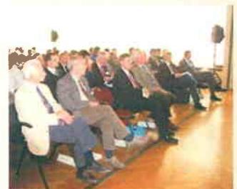
Eröffnung des TPE 06. 16.05.2006